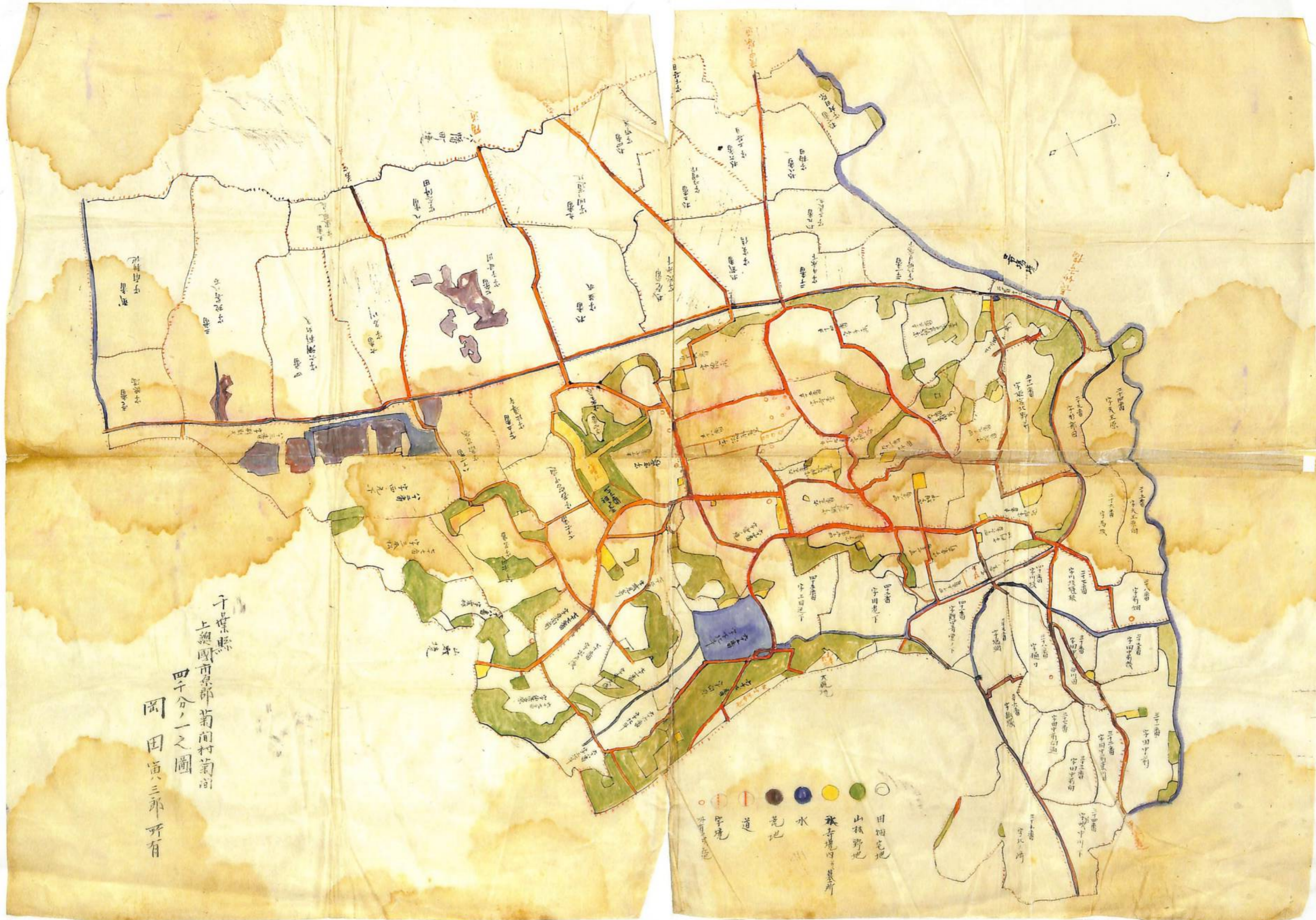
明治後期 「菊間 4000 分の 1 岡田寅三郎複製図」 市原市菊間岡田家文書 複製 = 市原の古文書研究会、八幡史学館名所 100 選チーム 平成 28 年 3 月 50% 縮小